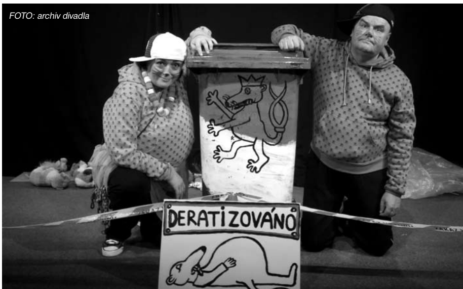
– Premiéra divadelní inscenace Krysáci se odehraje na prknech černošického Club Kino. –