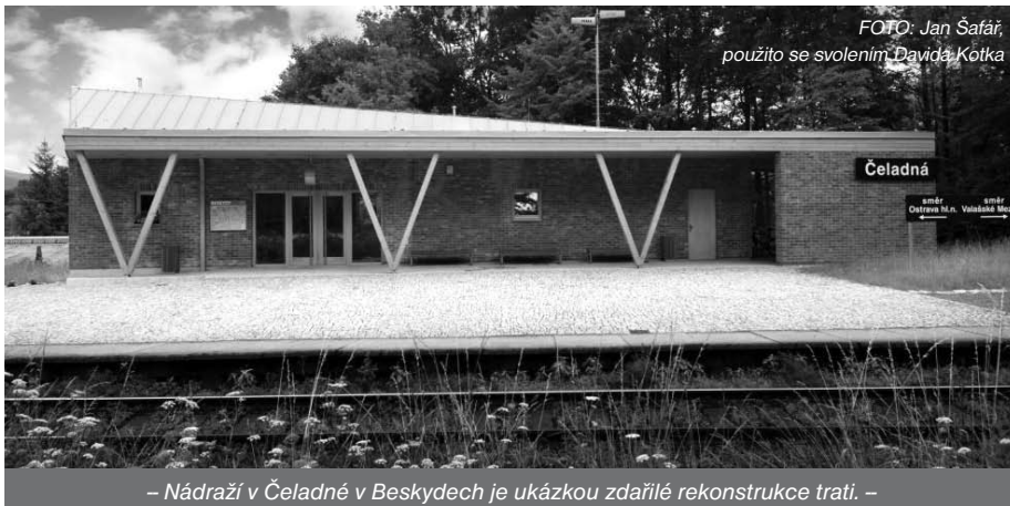
– Nádraží v Čeladné v Beskydech je ukázkou zdařilé rekonstrukce trati. –

Rekonstrukce železniční trati se ještě více přiblížila a nádraží v jeho současné podobě zvoni hrana. Rada města podle dostupných informací hodlá při jednání s investorem stavby (společností SŽDC) prosazovat variantu, v níž není vyloučeno, že současná staniční budova bude zbourána. V lepším případě má být zachována alespoň její dřevěná kolonáda, v tom horším má být i ona nahrazena typizovaným přístřeškem. Zanikla by tolik typická kompozice historické nádražní budovy se zahradou vzrostlých stromů za zády a nadto by nové nádraží mělo být degradováno na pouhou zastávku. Lze si domyslet, že pokud se úprava celého prostoru ponese v dosavadním duchu, můžeme se těšit na novou dávku plastového unifikátu a zámkové dlažby. Město se ještě více přiblíží beztvaremu pražskému satelitu a ztratí své kouzlo, nyní sice příkryté letitou patinou, ale přesto unikátní.