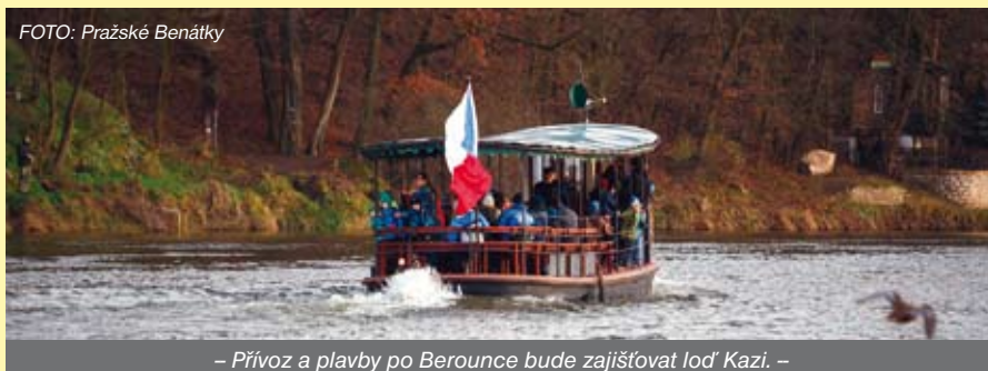
– Přívoz a plavby po Berounce bude zajišťovat loď Kazi. –