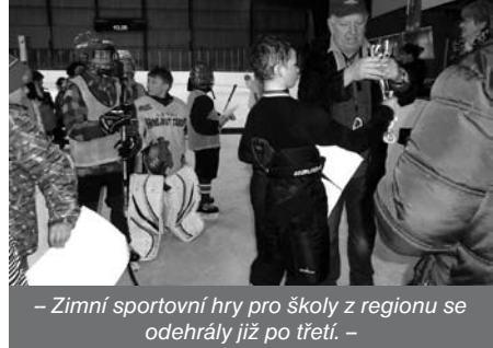
- Zimní sportovní hry pro školy z regionu se odehrály již po třetí. -

trénuje postřeh a kondici. Během jednoho zápasu naběhá i několik kilometrů. Kurt si lze rezervovat dle aktuálního rozpisu plochy. Kontakty na www.sk-černošice.cz .