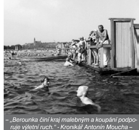
– „Berounka činí kraj malebným a koupání podporuje výletní ruch.“ - Kronikář Antonín Moucha -