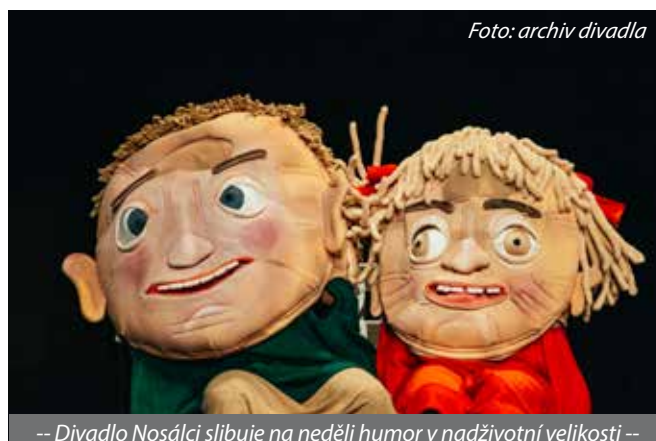
-- Divadlo Nosálci slibuje na neděli humor v nadživotní velikosti --