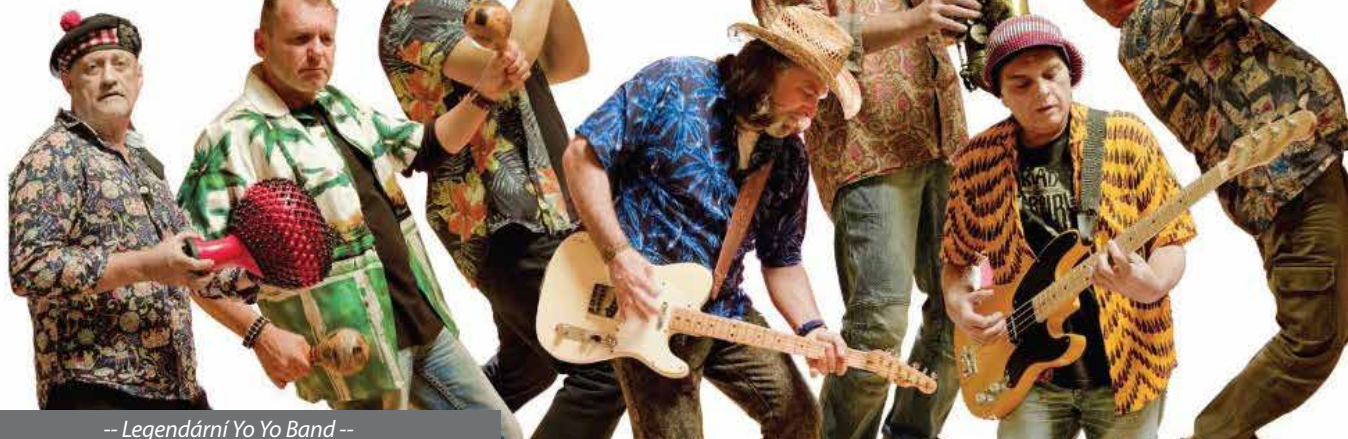
-- Legendární Yo Yo Band --