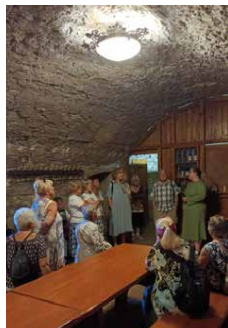
-- Hrad Roudnice --

V září (středa 3. 9.) pojedeme do hřebčína v Kladrubech a na zámek Karlova