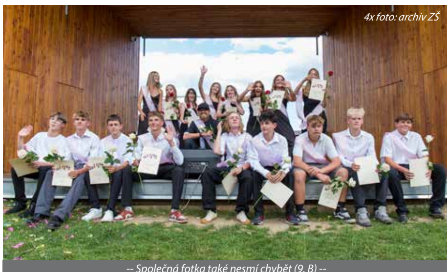
4x foto: archiv ZŠ