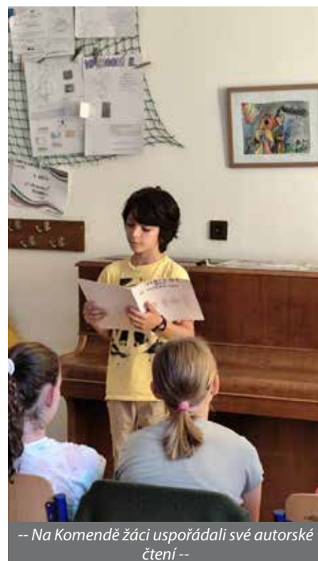
-- Na Komendě žáci uspořádali své autorské čtení --