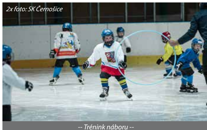
-- Trénink náboru --

Lední hokej není jen sport – je to dobrodružství, které učí děti týmové práci, odvaze a radosti z pohybu. Oddíl ledního hokeje SK Černošice otevírá nábor pro děti ve věku 4 až 8 let a zve všechny malé sportovce a sportovkyně, kteří chtějí zažít hokejovou atmosféru na vlastní kůži.