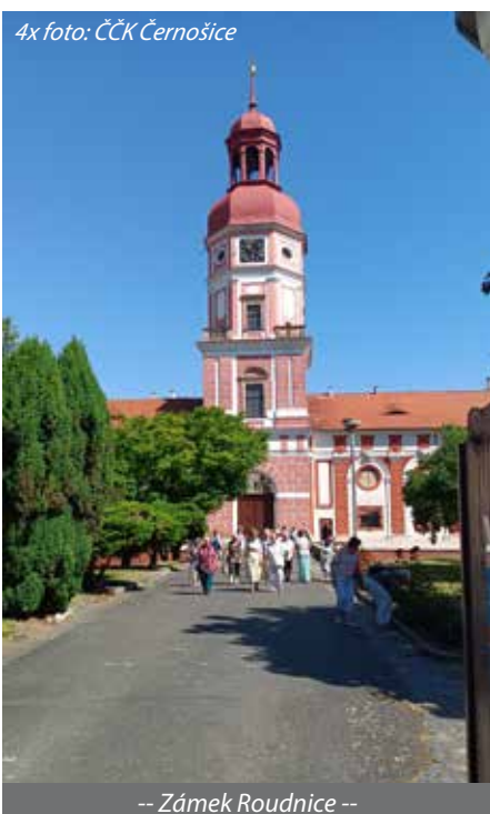
-- Zámek Roudnice --