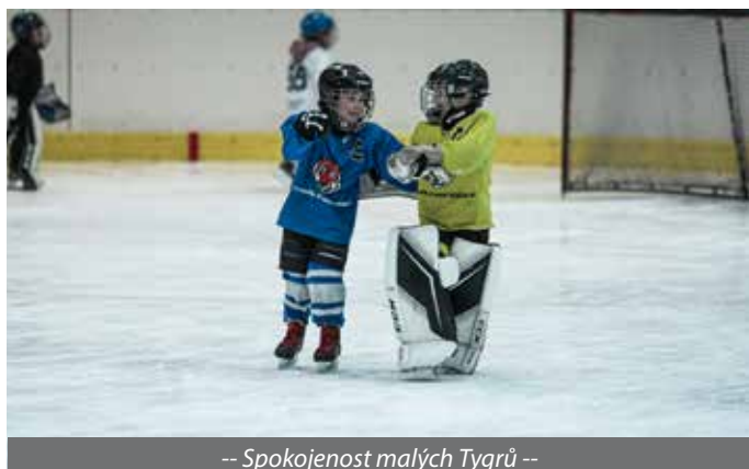
-- Spokojenost malých Tygrů --