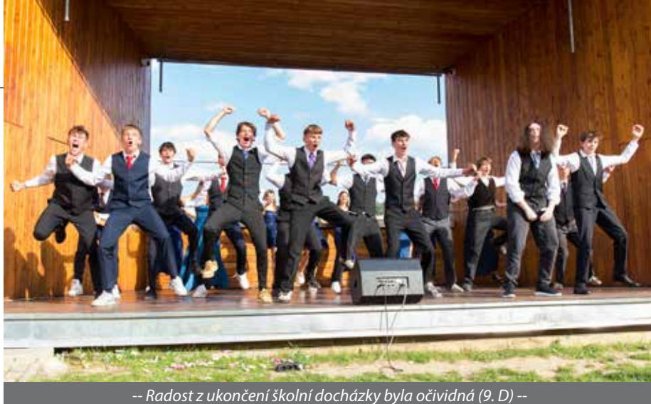
-- Radost z ukončení školní docházky byla očividná (9. D) --