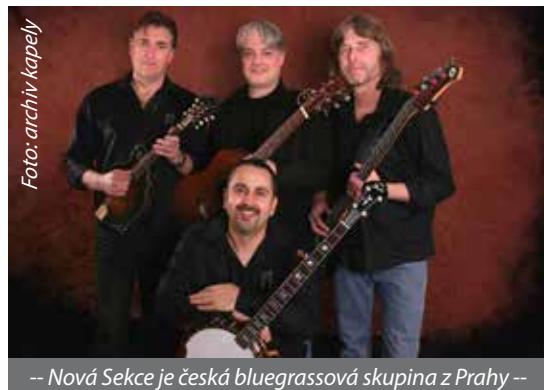
-- Nová Sekce je česká bluegrassová skupina z Prahy --

U zrodu kapely Dolls in the Factory stál v roce 2011 zpěvák Mirai Navrátil. Jde o elektronický pop rockovou kapelu z Frydku-Místku. Za své působení vydala EP Hurricane (2012) a album Statues (2013), ze kterého je i skladba Believe známá díky filmu Křídla Vánoc. Zakládající členové Mirai Navrátil a Šimon