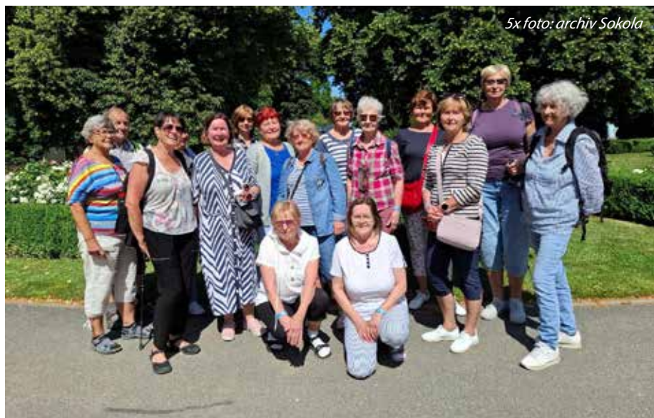
5x foto: archiv Sokola