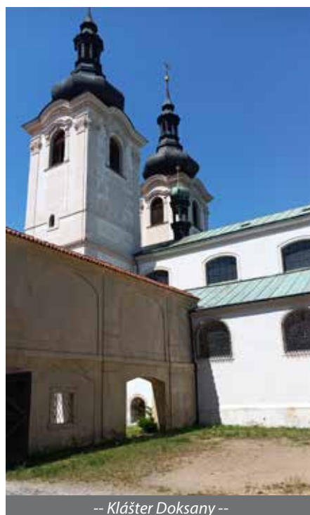
-- Klášter Doksany --