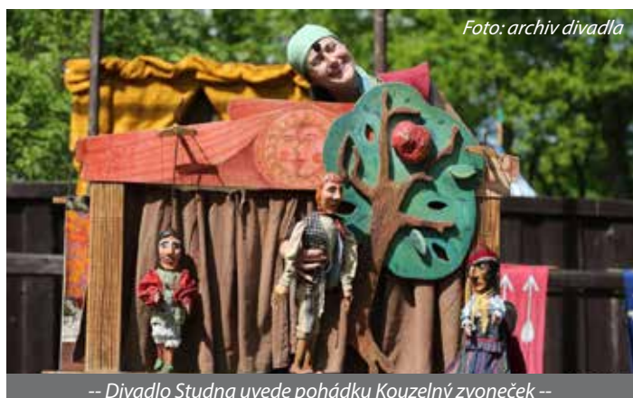
-- Divadlo Studna uvede pohádku Kouzelný zvoneček --