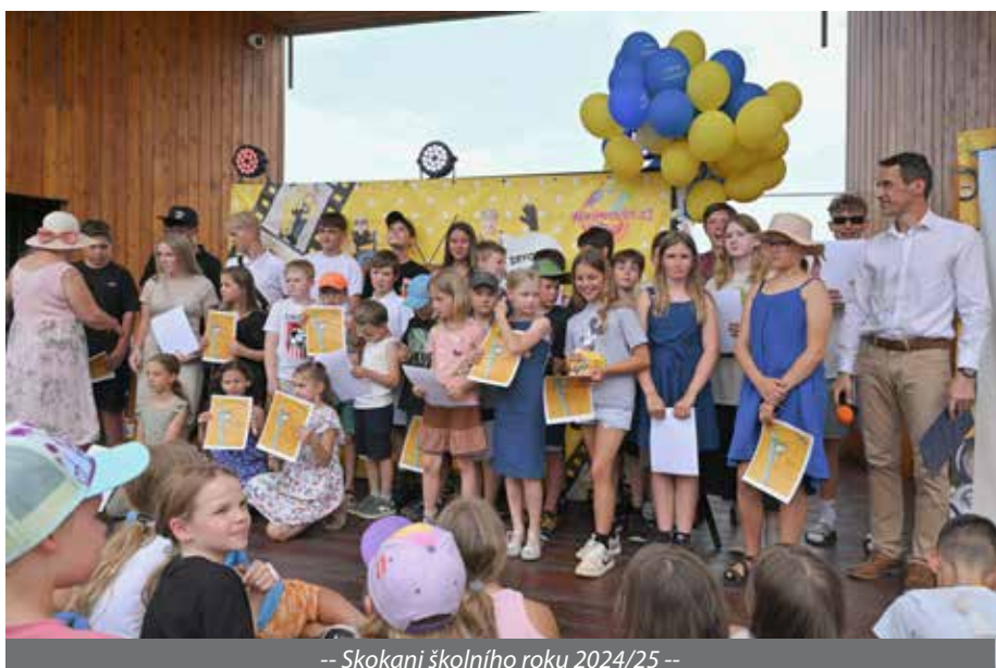
-- Skokani školního roku 2024/25 --