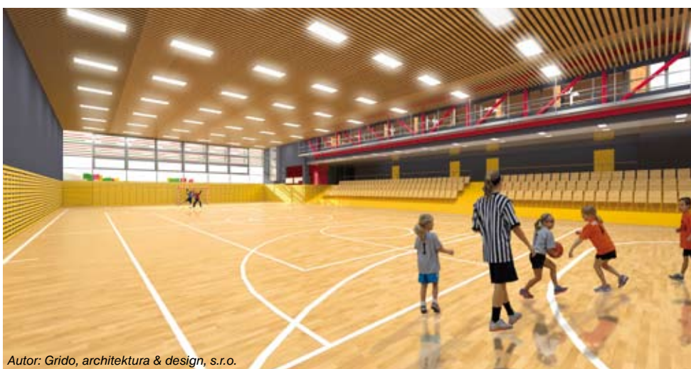
Autor: Grido, architektura & design, s.r.o.

Kdy: sobota 14. 2. v 11.00 Kde: u ZŠ Mokropsy