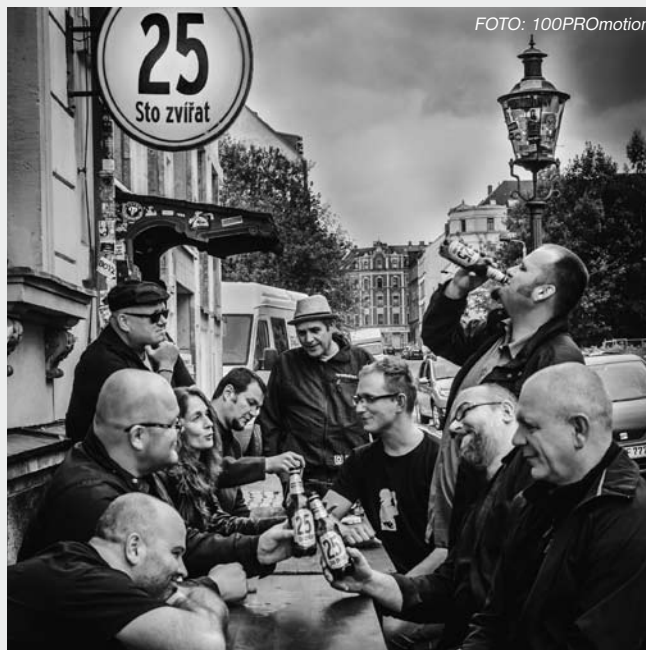
– Na koncertu kapely Sto zvířat zazní všechny jejich největší hity. –