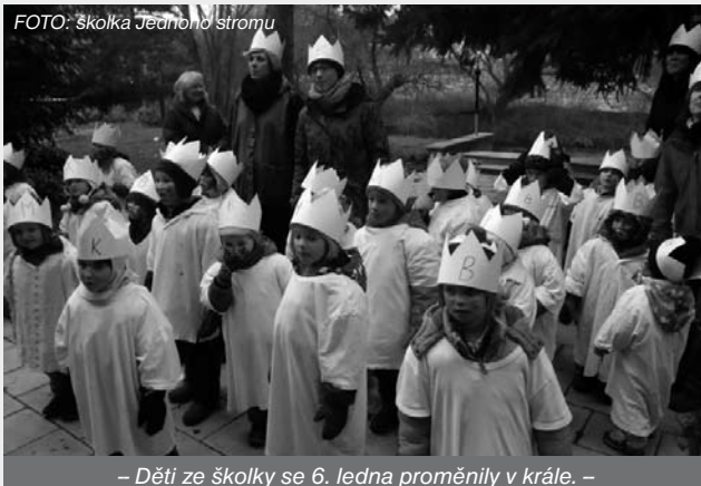
– Děti ze školky se 6. ledna proměnily v krále. –