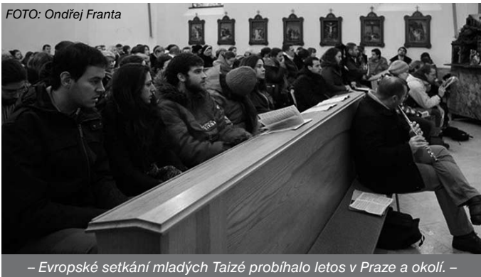
– Evropské setkání mladých Taizé probíhalo letos v Praze a okolí. –

Letos byl kostel během dopoledních bohoslužeb neobvykle přeplněný. V rámci evropského setkání Taizé se zde totiž sešli 4 faráři z různých částí Evropy – domácí, z Francie, Španělska a Ruska. U příležitosti tohoto evropského setkání mladých v Praze („pouť důvěry na zemi“) přijeli do Černošic mladí poutníci z Chorvatska, Ruska, Polska, Běloruska, Ukrajiny, Francie a Španělska – pro nás velmi vzácní hosté. V rodinách a ve škole jsme ubytovali celkem 112 poutníků. Další pak byli ubytováni ještě prostřednictvím Bratrské církve na Vrážích.