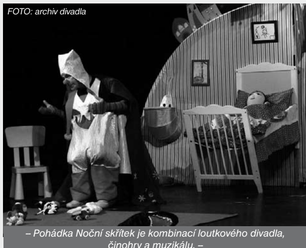
– Pohádka Noční skřítek je kombinací loutkového divadla, činohry a muzikálu. –