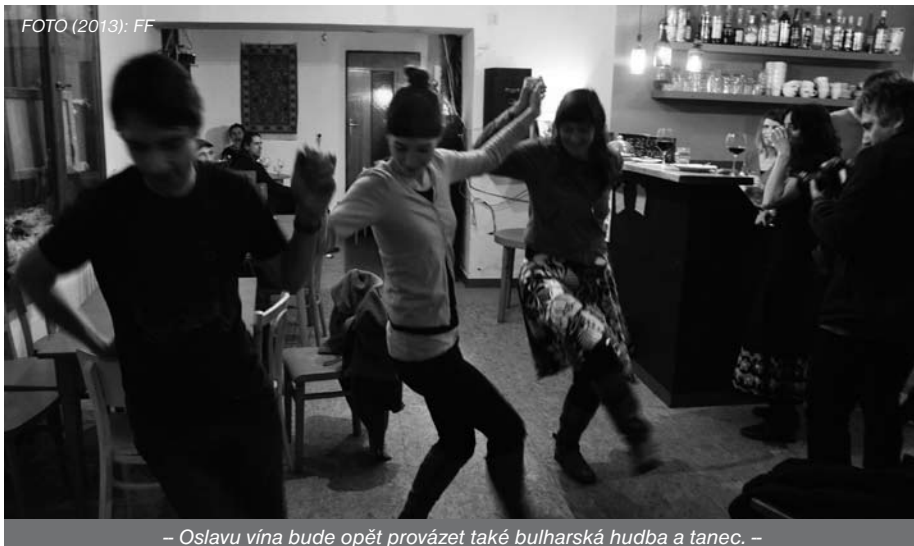
– Oslavu vína bude opět provázet také bulharská hudba a tanec. –

sv. Trifona Zarezana. Trifon je patronem vína a všech vinařů. Na jeho svátek, jenž připadá právě na 14. únor, začíná oficiálně vinařský rok obřadním řezáním vinné révy. To se neobejde bez hromadných tanců, zvaných choro, z nichž přímo čiší radost ze života. Jiskřivé víno teče