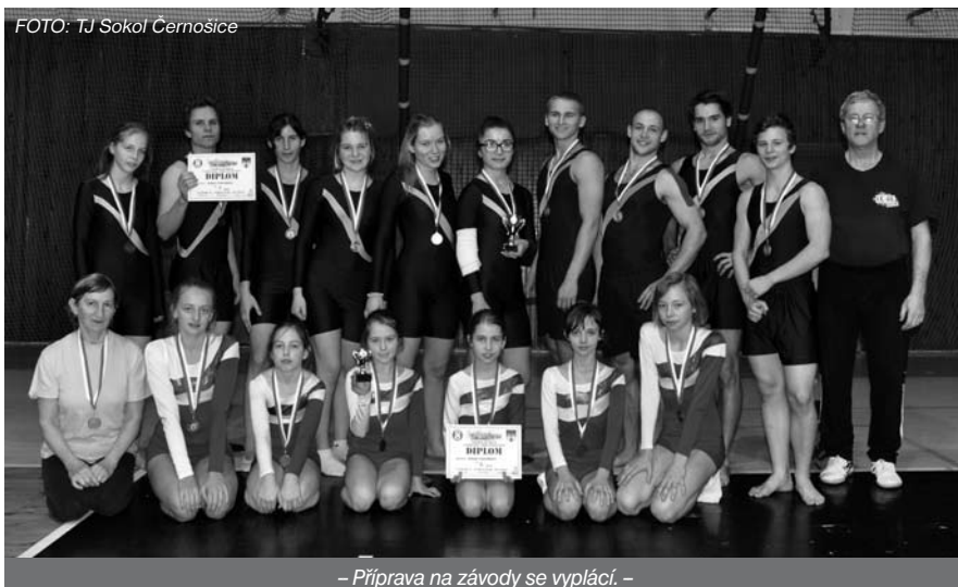
– Příprava na závody se vyplácí. –