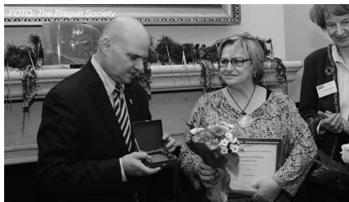
– Prestižní ocenění získala Věra Čáslavská za svoji celoživotní službu veřejnosti. –

Osudnými se jí staly olympijské hry roku 1968 v Mexiku, kde získala hned 4 ze svých zlatých olympijských medailí. Při ceremonii předávání medailí s ní společně na stupínku stála také sovětská gymnastka. A když hrála sovětská hymna, odvrátila hlavu od soupeřky a dívala se do země. Tento