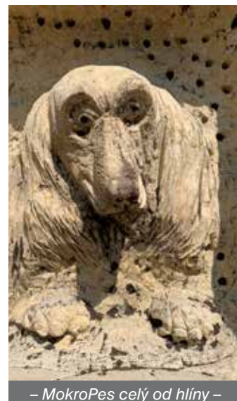
– MokoPes celý od hlíny –