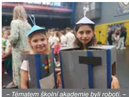
– Tématem školní akademie byli roboti. –

Pottera. Bylo to vše hezky uděláno a byly s námi super učitelky. Doporučuji všem, ať jedou!!!“