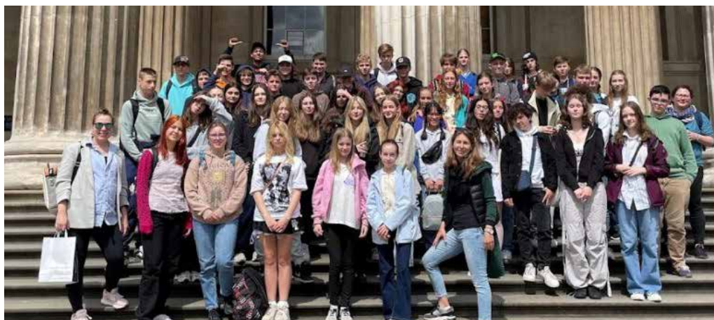
– Nadšení účastníci zájezdu do Anglie před Britským muzeem –

Začátek června patřil v naší škole již tradičně školní akademii. Letošním tématem se stala umělá inteligence a roboti. Ve čtvrtek 8. června tak mohli rodiče i přátelé naší školy zhlédnout v hale Věry Čáslavské celkem deset vystoupení tříd