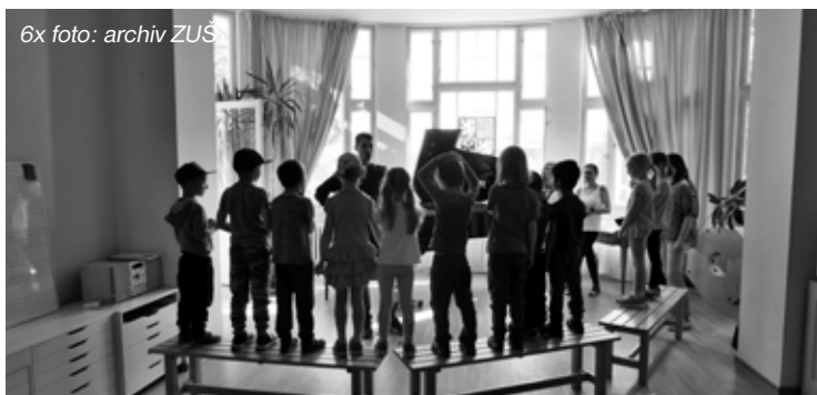
– Děti z mateřských škol poznávaly všechny tři obory naší ZUŠ. –