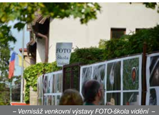
– Vernisáž venkovní výstavy FOTO-škola vidění –

Tím jsme zakončili ZUŠ OPEN týden, během kterého Černošice ožily tvorbou našich žáků a učitelů. Všem znovu děkujeme za zcela nadstandardní nasazení a energii, kterou do akcí vložili.