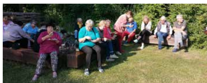
– V programu nechybělo ani tradiční opékání buřtů... –