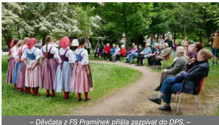
– Děvčata z FS Pramínek přišla zazpívat do DPS. –