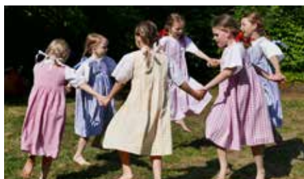
– Děti z 1. ročníku tanečního oboru přivítaly nové černošické občánky a zatančily si i na zahradě. –