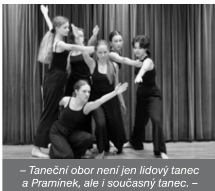
– Taneční obor není jen lidový tanec a Pramínek, ale i současný tanec. –