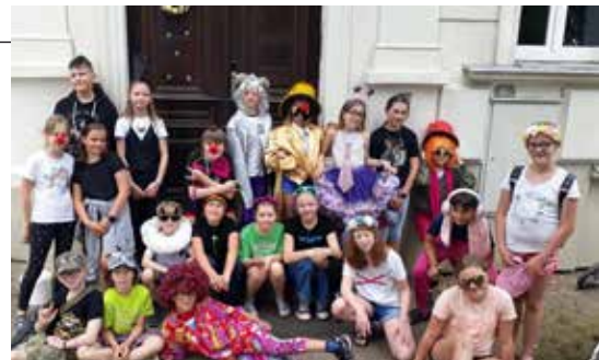
– Páťáci zorganizovali pro své spolužáky na Komendě oslavu Dne dětí. –

Letos uplynulo 100 let od narození německého spisovatele a libereckého rodáka Otfrieda Preusslera. Zároveň je