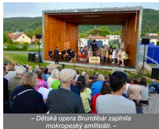
– Dětská opera Brundibár zaplnila mokropeský amfiteátr. –