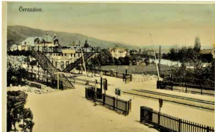
– ... a kolem roku 1910. –