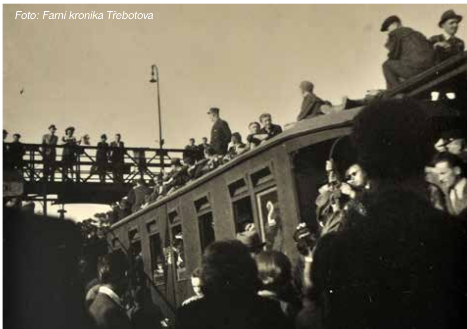
– Fotografie zaznamenává situaci těsně po válce, kdy davy lidí od nás (zastávka Horní Černošice) chtěly vidět prezidenta Beneše vracějícího se do Prahy z exilu (16. 5. 1945). –