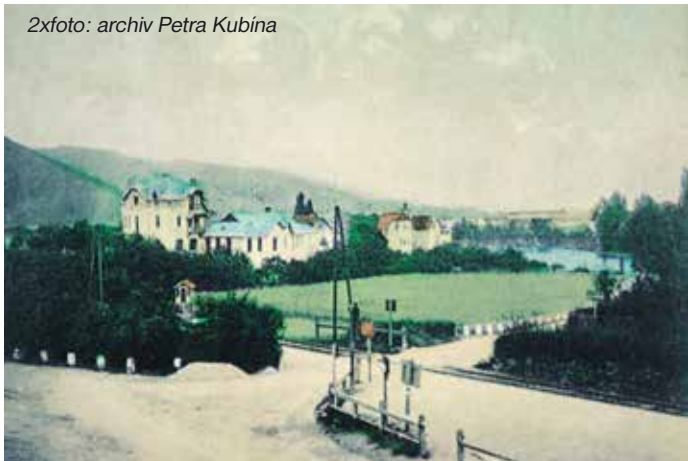
– Nádraží v Horních Černošicích v roce 1900... –