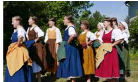
– Nejstarší žačky zatančily na pásmo písní z 18. stol. sebrané Otakarem Hostinským. –