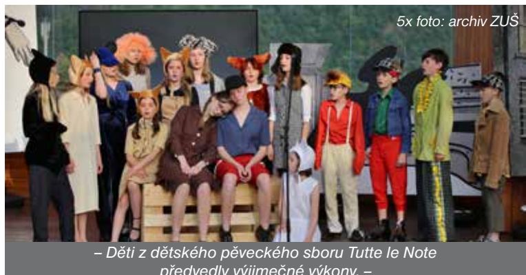
– Děti z dětského pěveckého sboru Tutte le Note předvedly výjimečné výkony. –