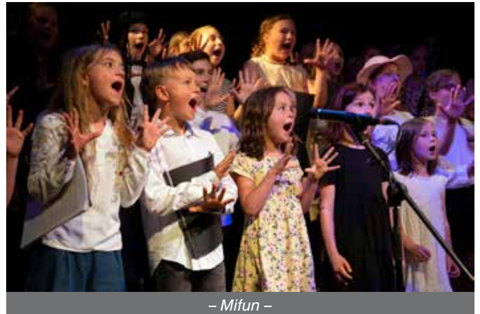
– Mifun –