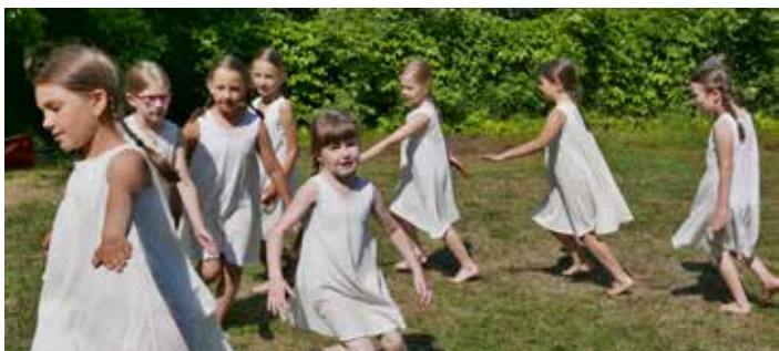
– Na závěrečném vystoupení tanečního oboru se představili ti nejmenší. –