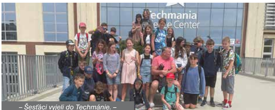
– Šestáci vyjeli do Techmánie. –

Městské kino Beroun hostilo v pondělí 12. června závěrečnou prezentaci projektu Příběhy našich sousedů z regionu Berounsko. Kromě týmu z naší školy se zúčastnili ještě žáci a studenti z Berouna a Loděnice.