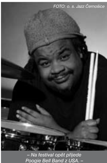
– Na festival opět přijede Poogie Bell Band z USA. –