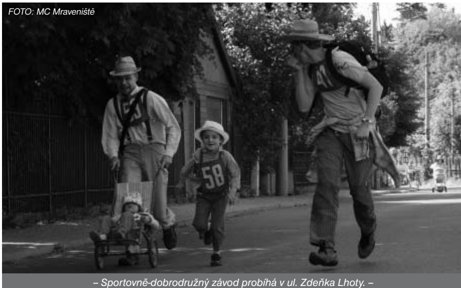
– Sportovně-dobrodružný závod probíhá v ul. Zdeňka Lhoty. –