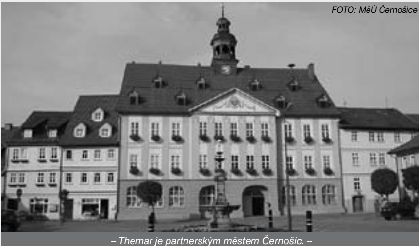
– Themar je partnerským městem Černošic. –