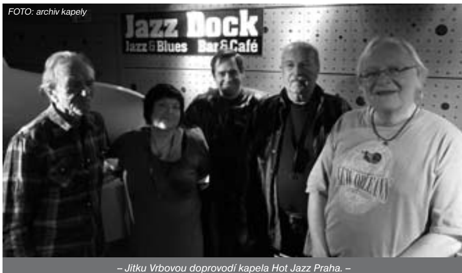
– Jitku Vrbovou doprovodí kapela Hot Jazz Praha. –