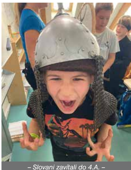
– Slované zavítali do 4.A. –