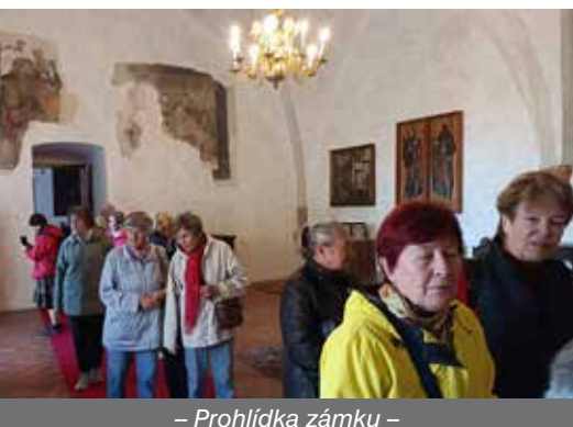
– Prohlídka zámku –