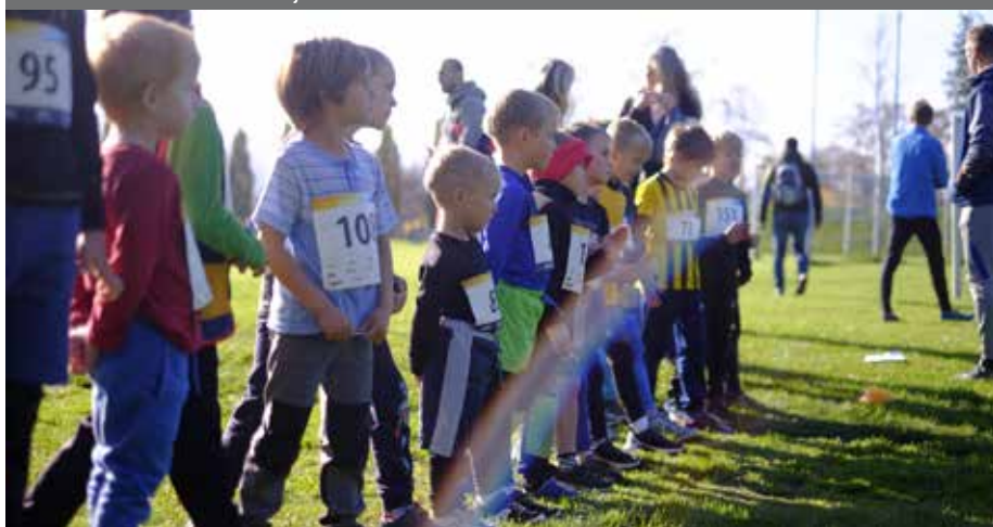
– Nejmladší účastníci Dobřichovického běhu –