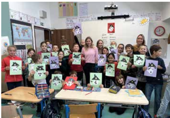
– 4.B se učila o Halloweenu od rodičů Američanů. –