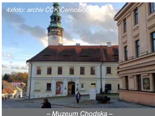
– Muzeum Chodska –