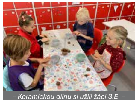
– Keramickou dílnu si užili žáci 3.E –

Každý má ve svém okolí něco dřevěného, s něčím dřevěným se setkáváme každý den a každý jistě kus dřeva měl v ruce. My jsme si ukázali, že dřeva opravdu nejsou stejná. Děti si prohlédly struktury i barvy dřev našich neznámých-