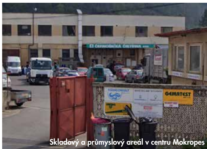
Skladový a průmyslový areál v centru Mokropes