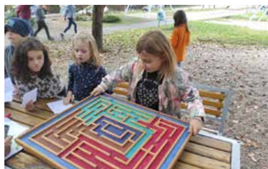
– Veselá podzimní olympiáda vyzkoušela dětskou zdatnost. –