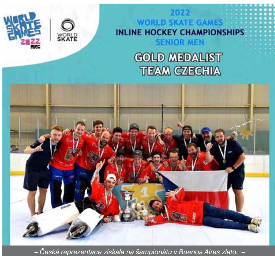
– Česká reprezentace získala na šampionátu v Buenos Aires zlato. –

Myslím si, že by se děti neměly od útlého věku specializovat na jeden sport. Je dobré jich vyzkoušet více a vybrat ten, který mu přináší největší radost. A pro