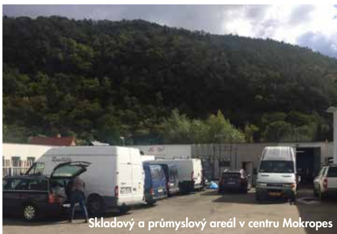
Skladový a průmyslový areál v centru Mokropes