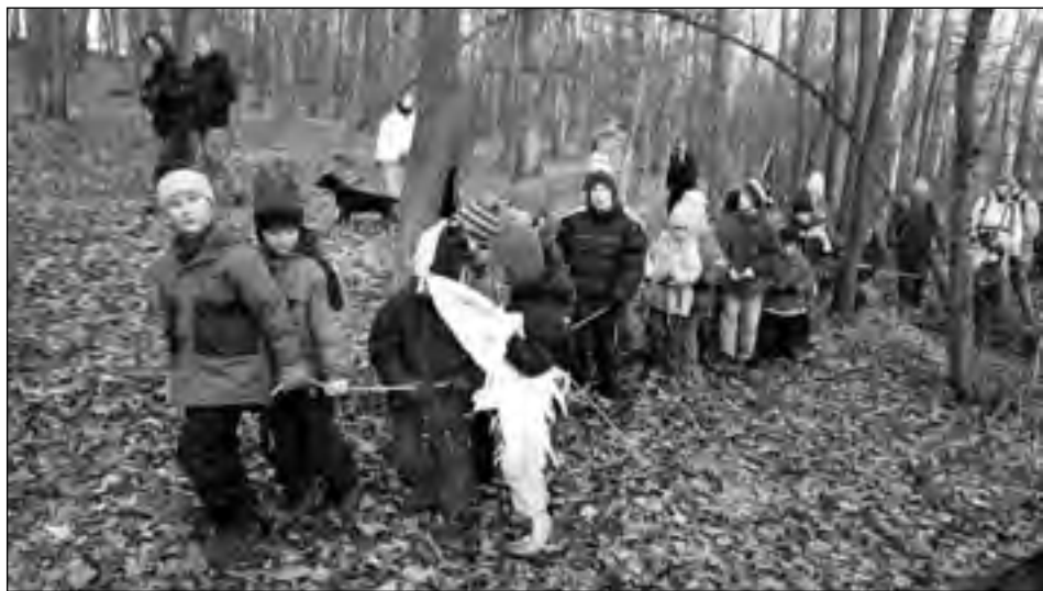
Cesta k pólu nebyla jednoduchá. Na polárníky padl lesní opar a mlha a proto se pro jistotu museli zachytit dlouhého lana, aby se nikdo neztratil.