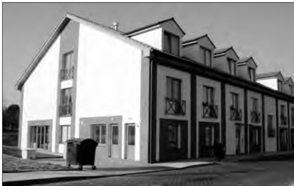
Nové Denní centrum pro seniory sídlí v pěkném Domě s pečovatelskou službou.

Bližší informace na adrese Farní charita Neratovice, Kojetická 1021, tel.: 315 685 190, charita@mnet.cz. nebo přímo u vedoucí denního centra pí Pavlicové tel.: 602 258 159. (js)