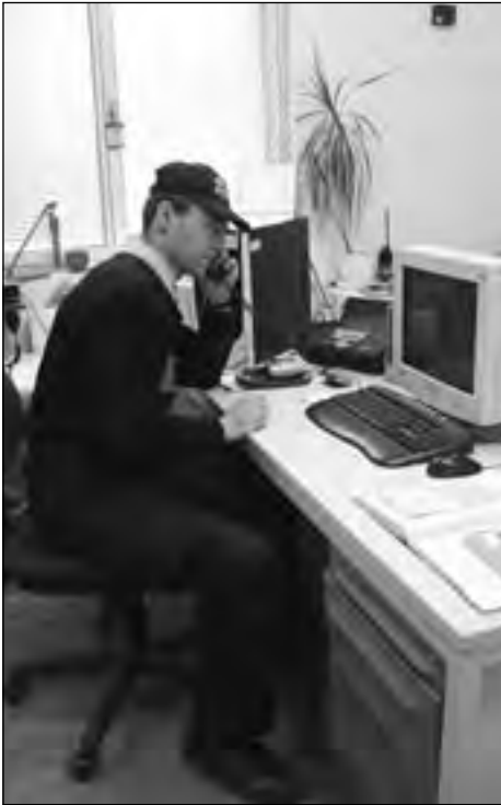
U centrální pultu v policejní služebně přijímají strážníci telefonáty těch, kdož potřebují pomoc

V posledních měsících se velice zlepšila vnímavost obyvatel ke svému okolí a jejich spolupráce s policisty, což je, současně se zodpovědným chováním každého z nás, pro dobrou situaci ve městě nezbytné. Strážníků máme pouze pět a nemohou být všude. Helena Langšádlová, starostka