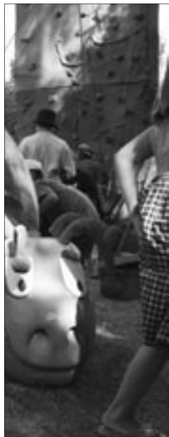
Vedle kostela Nanebevzetí p. Marie vztýčili skauti lezeckou stěnu. Každý se mohl pokusit dosáhnout nebeských výšin vlastní silou.