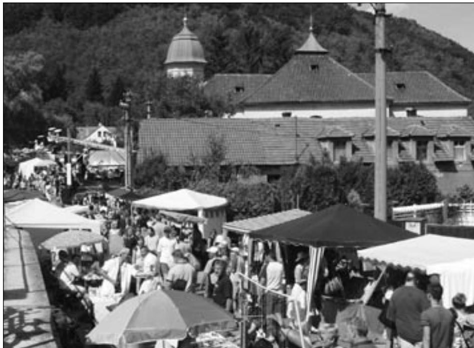
Sobota 16. srpna – U stánků s předměty lidové tvorby