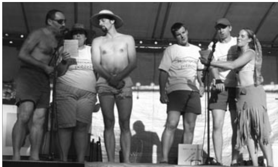
Pro velké diváky kabaret následovníků B. Slováčka ukázal všední den mokropeské pobřežní hlídky