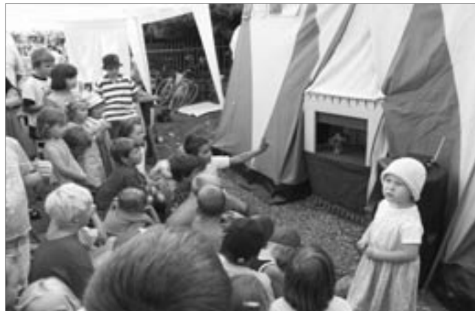
Malí diváci sledovali malé divadlo

Za to, že to všechno dali letos zase dohromady, se samozřejmě sluší poděkovat všem, kteří se tam starali a vystupovali. Ten, kdo nebyl vidět, ale všechno to zařídil, byl Petr Pánek (říká, že letos opravdu naposledy). Pódium tam nezištně dodal Josef Barchánek, plakát vyrobila paní Bláhová, krásné počasí opatřil... O. Hokr