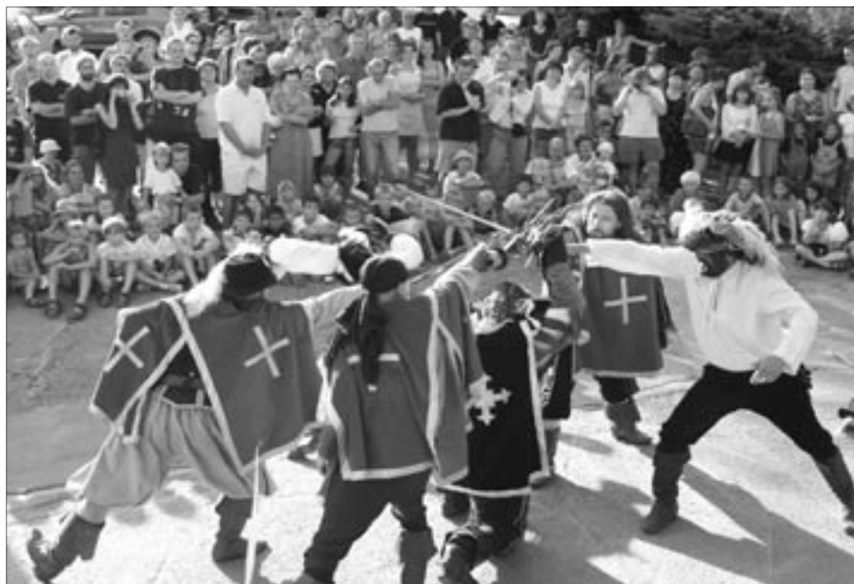
Alotrium vždycky zaujme, má už i stále příznivce