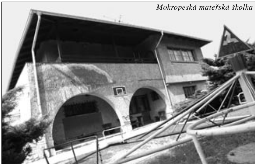
Mokropeská mateřská školka

sobota 27. září v 19.00 hod. MAJEROVY BRZDOVÉ TABULKY – koncert v Sále Dr. Fürsta