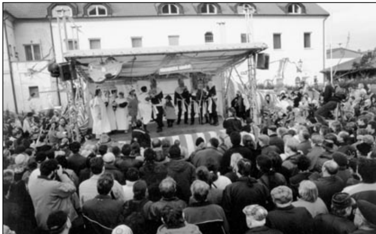
14. Mokropeský masopust se konal 9. února. Nepršelo. Bylo vidět a slyšet díky firmě ŠIBA a Michalovi.