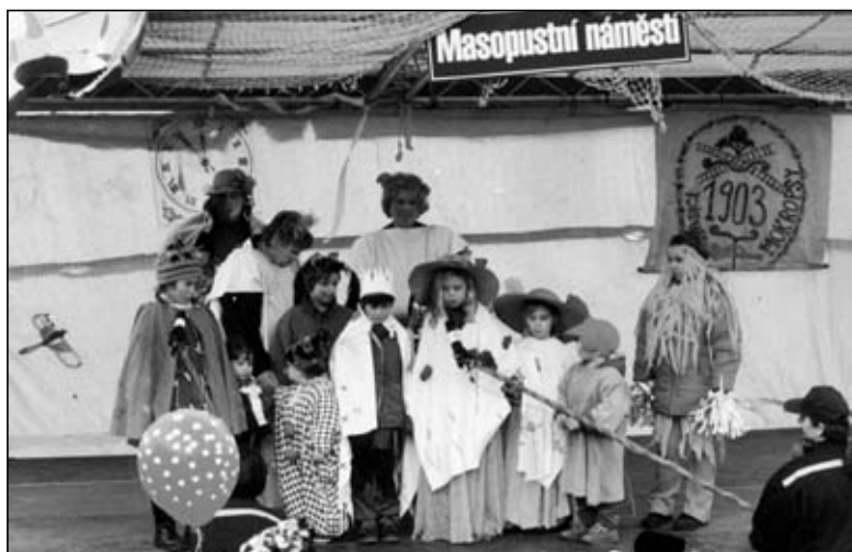
Již počtrnácté se náměstíčko stalo Masopustním i co do názvu. Dětské masky čekalo 50 kobližek z mokropeské pekárny.