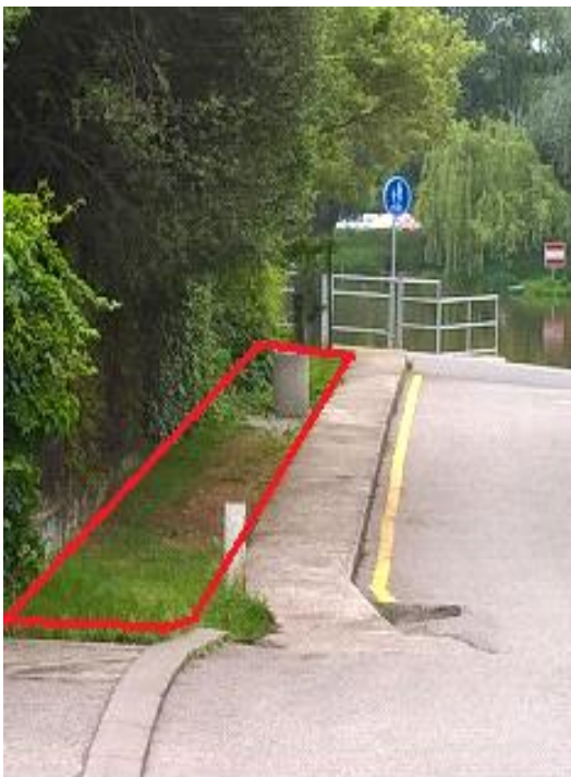
Foto pozemku v ul. Kazínská

Návrh usnesení je předložen v obou variantách, že návrh na pořízení změny územního plánu dle přílohy bude/nebude projednáván.