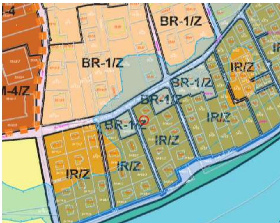
Výřez z hlavního výkresu UP se zobrazením aktivní zóny a záplavového území Q5

v souladu s § 46 odst. 3 zákona č.183/2006 Sb., o územním plánování a stavebním řádu, že návrh na pořízení změny územního plánu na pozemku parc.č. 5461/1 a 5461/6 v k.ú. Černošice dle přílohy nebude projednáván ve změně Územního plánu Černošice