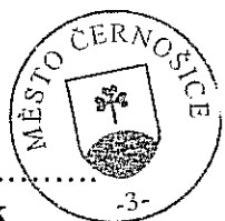
Mgr. Filip Kořínek starosta města Černošice