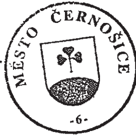
Mg. Filip Kořínek Pronajímatel